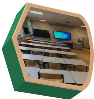
Salles de cours, matériel audio et vidéo