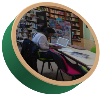
Centre de documentation