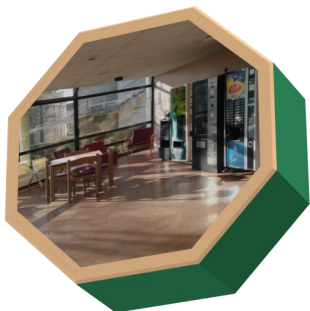
Foyer, espace de détente