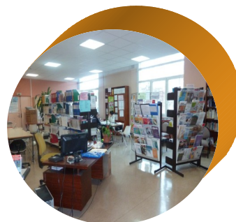
Centre de documentation