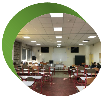
Salle de cours avec une installation pour la visio-conférence