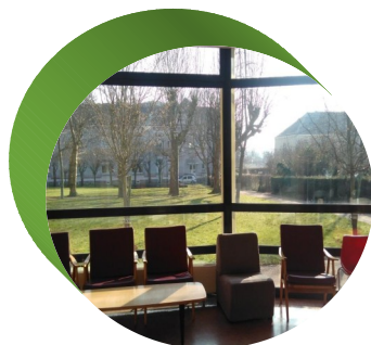
Salle de détente des étudiants